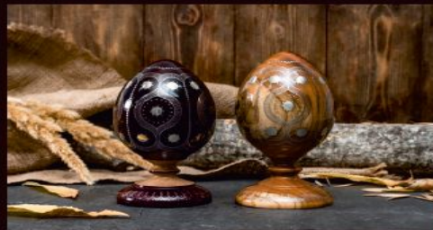
Сольницы по 1000р