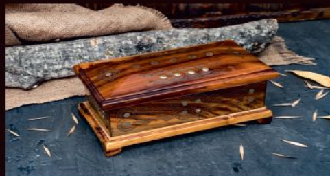
Шкатулка - 10000р