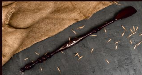
Ложки для обуви: длинная - 2000р