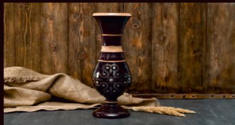
Ваза: большая - 10000р