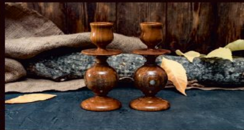
Подсвечники по 1500 р