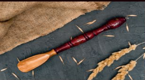
Ложки для обуви: мал. - 1000р сред. - 1500р

Унцукульские изделия из дерева ценных пород инкрустированные мельхиором Подсвечники, карандашницы, сольницы, вазы, ложки для обуви, шкатулки