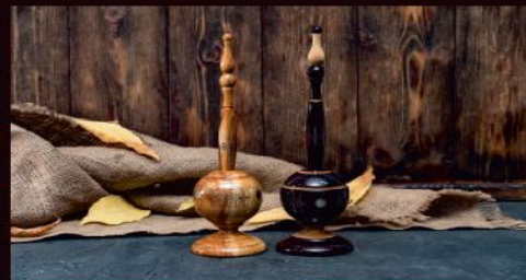
Ручка на подставке - 1500р