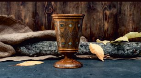
Ваза: мал. - 1500р сред. - 3000р