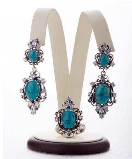
Кольцо 925 Арт: B2-1000 Вес: 8,1 Размер: 19,5