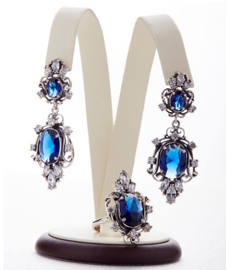
Кольцо 925 Арт: B2-1000 Вес: 8,5 Размер: 19