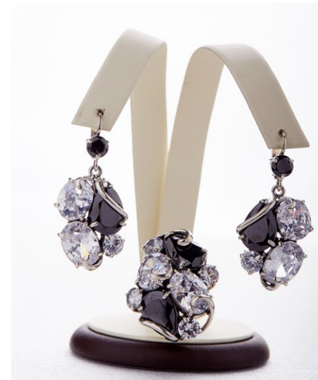
Кольцо 925 Арт: B31-1890 Вес: 19,3 Размер: 19