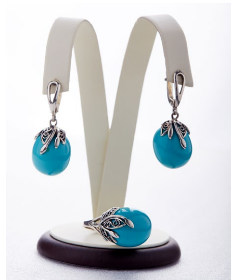
Кольцо 925 Арт: В7-684 Вес: 12,3 Размер: 19,5