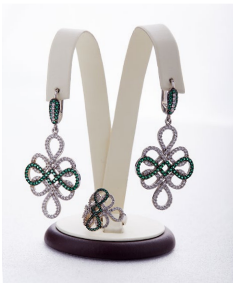
Кольцо 925 Арт: В30 -950 Вес: 4,72 Размер: 18