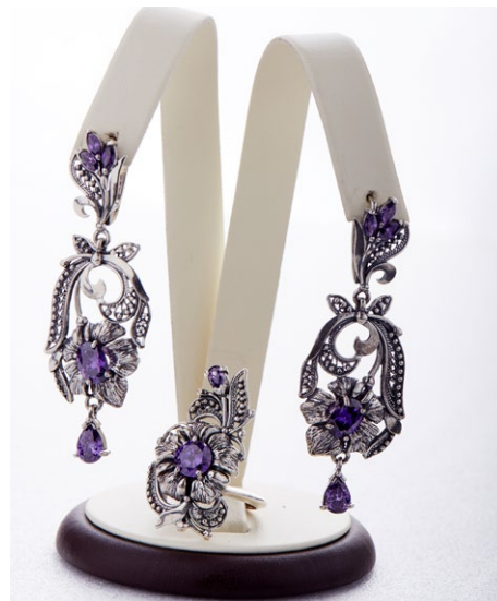
Кольцо 925 Арт: В52-1000 Вес: 8,6 Размер: 18,5