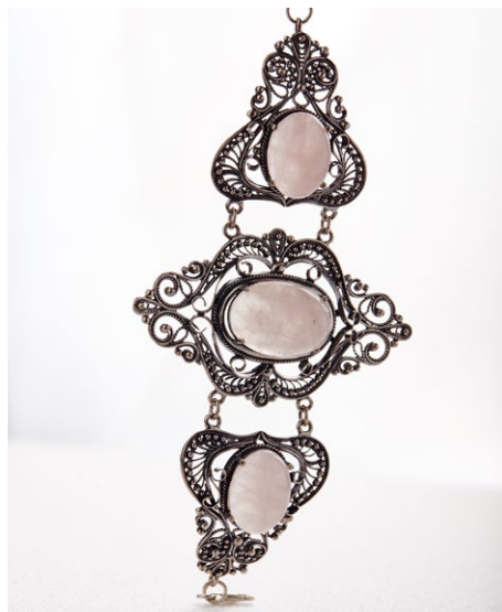
Браслет 925 Арт: B25-4000 Вес: 51,60 Покрытие: Оксидировка Кварц