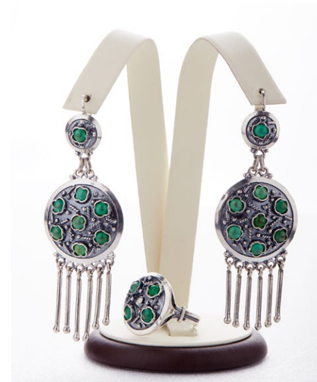
Кольцо 925 Арт: В2-980 Вес: 6,10 Размер: 19