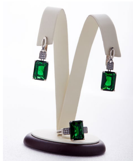
Кольцо 925 Арт: АС-020 Вес: 4,15 Размер: 18,5