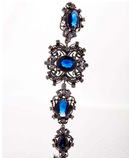
Браслет 925 Арт: B2-4200 Вес: 41,1 Покрытие: Оксидировка Цирконий