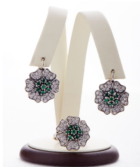
Кольцо 925 Арт: B45-800 Вес: 7,5 Размер: 19