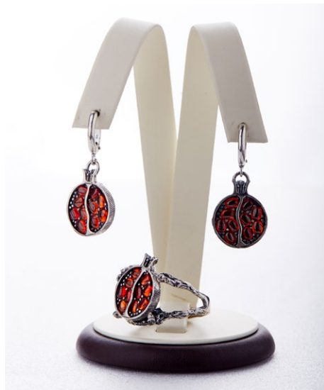
Кольцо 925 Арт: ИС-04 Вес: 10,8 Размер: 21