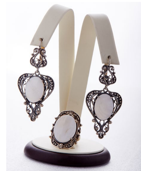
Кольцо 925 Арт: В30-1000 Вес: 9,80 Размер: 18