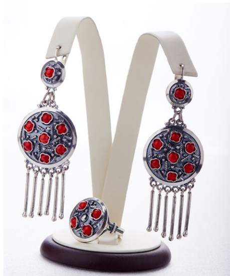
Кольцо 925 Арт: Л-17 Вес: 6,80 Размер: 18,5