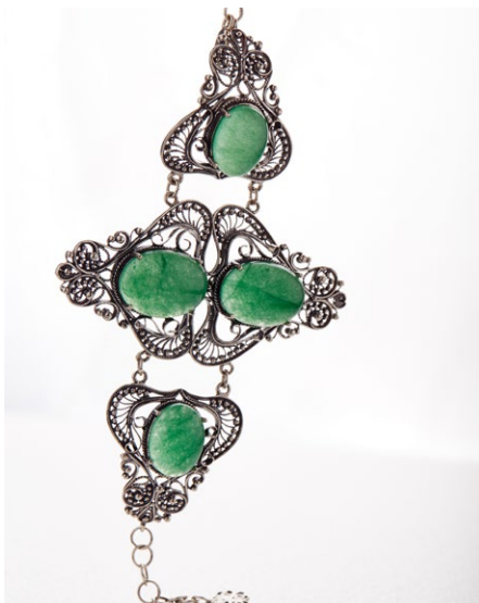
Браслет 925 Арт: B27-4500 Вес: 51,60 Покрытие: Оксидировка Кварц